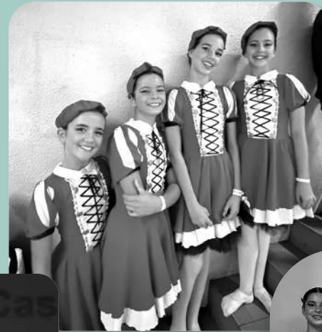
A Alegria de Brincar 1.º lugar