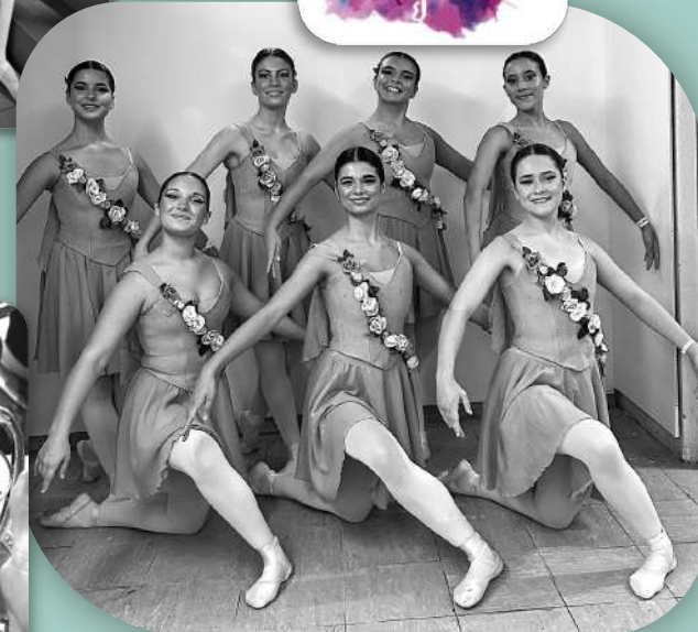
Despertar da Primavera 1.º lugar