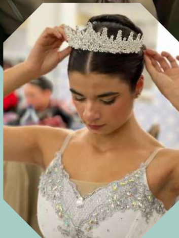
Estreia de Aurora